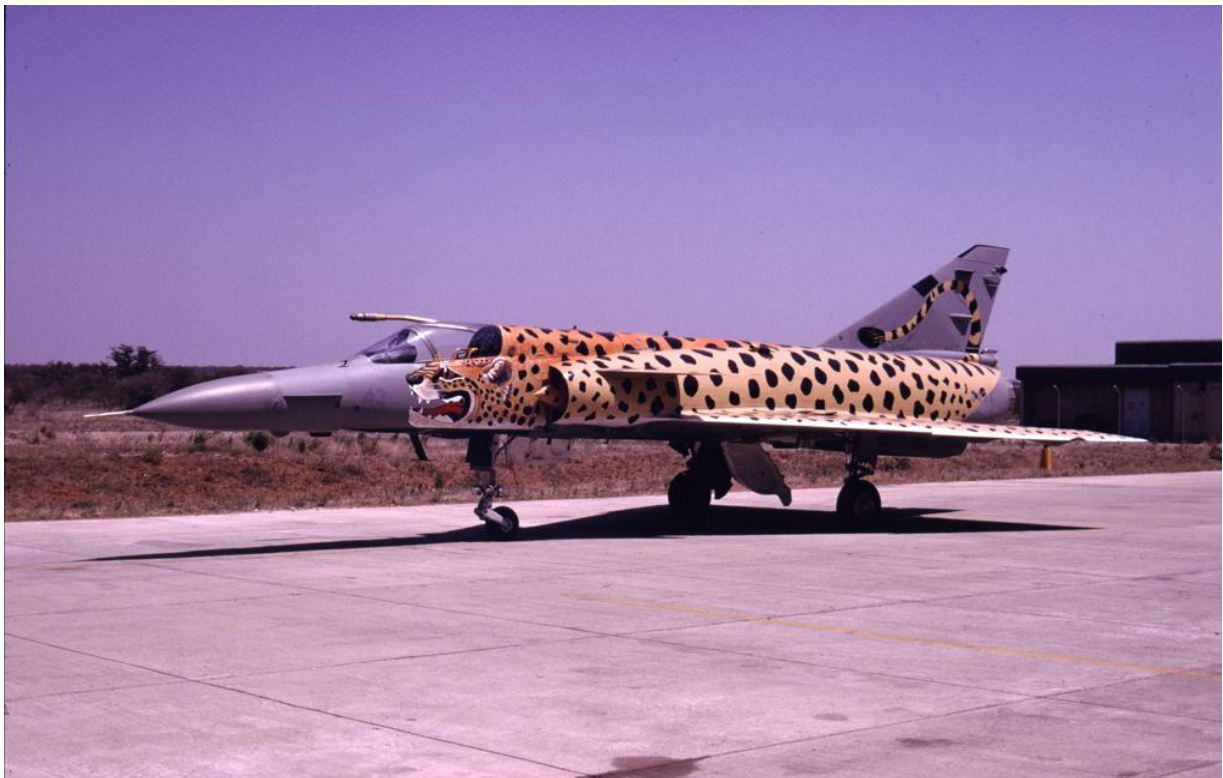
Cheetah C van 2 sqn in de bekende speciale beschildering in de jaren 90.

Zeker één Mirage IIIRZ, de 855 is, omgebouwd tot Cheetah R. Dit werd ook wel project 855 genoemd. Dit toestel werd niet voorzien van een bijtankbuis.